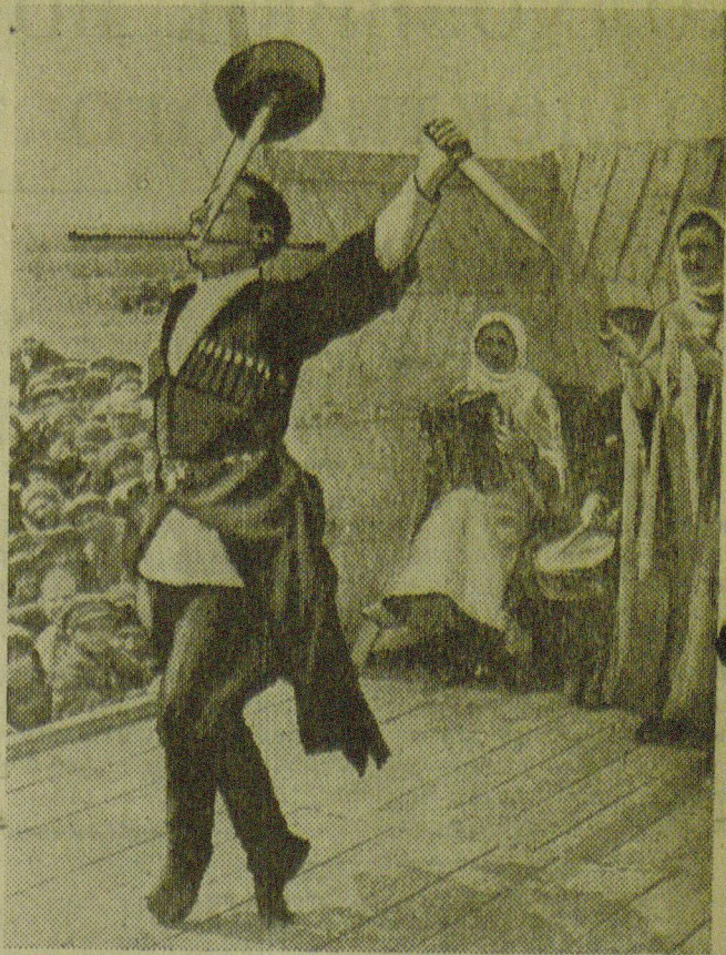
Выступление Черкесского ансамбля песни и пляски (на 14 участке, Егорлыкского района)