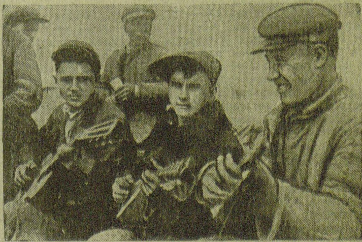
На 20 участке (Ростовская область) молодежь в часы отдыха.